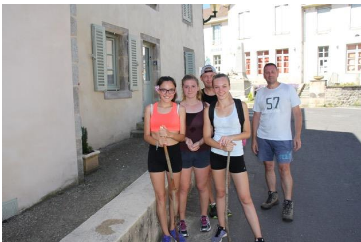
Au départ de la Marche de Chignore

Le versement prévu à l'association « Vivre avec Lafora » sur les bénéfices de la Marche de Chignore sera effectué lors de notre assemblée générale le vendredi 13 janvier 2017.