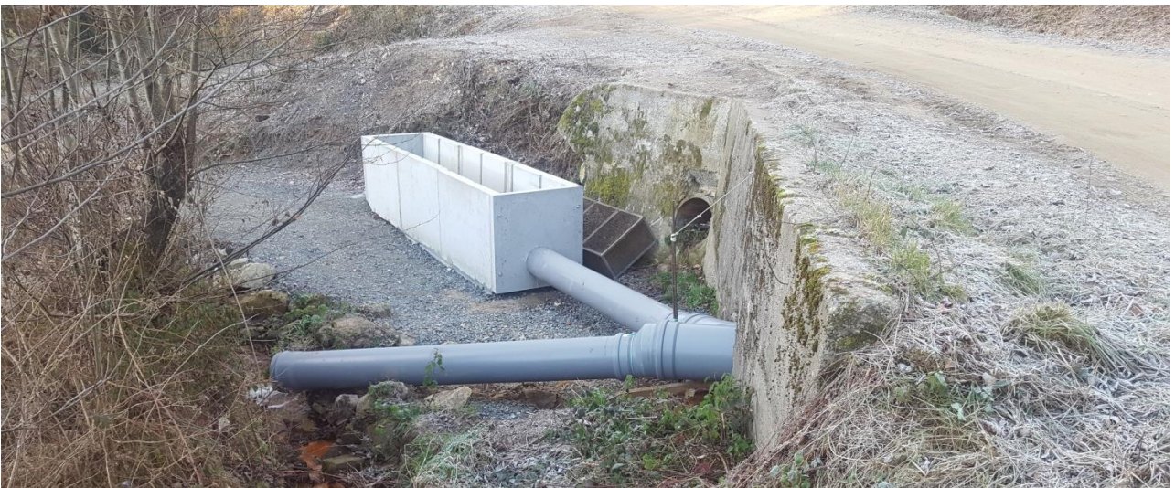
La pêcherie installée