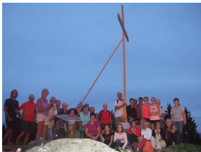
La Nocturne de Chignore