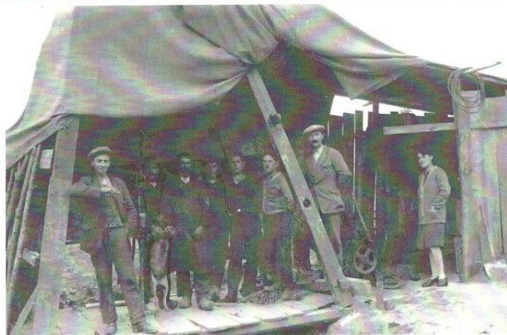
Les travaux de captage des eaux.