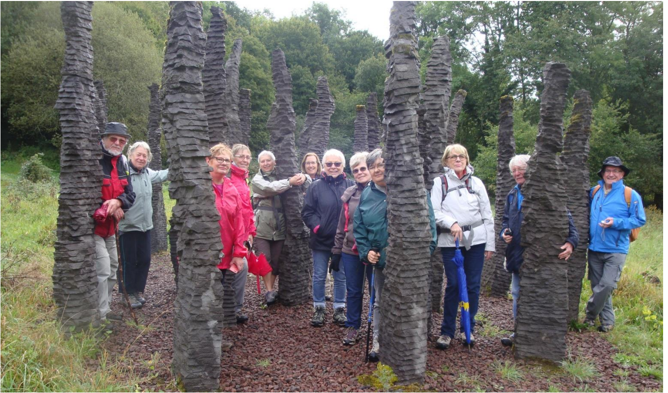
Vollorando à Chapdes Beaufort