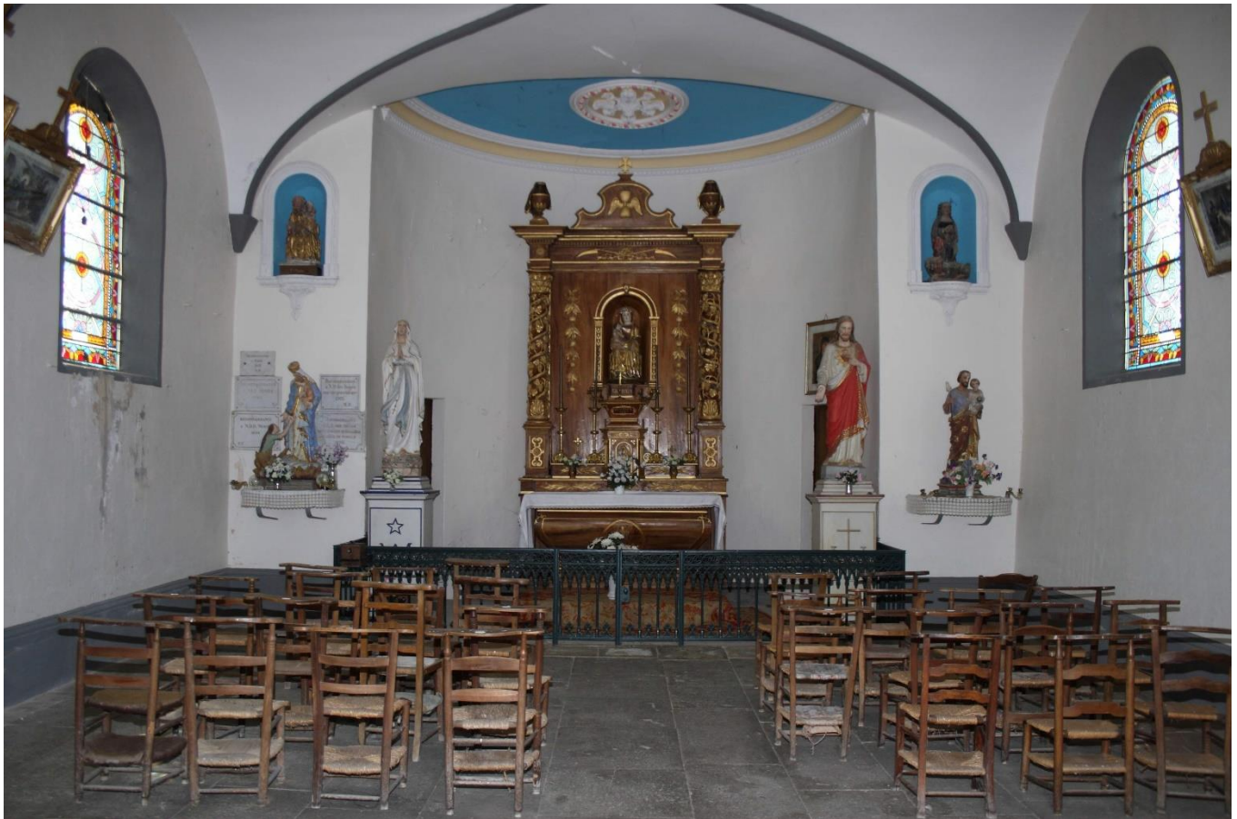
La Chapelle du Cimetière